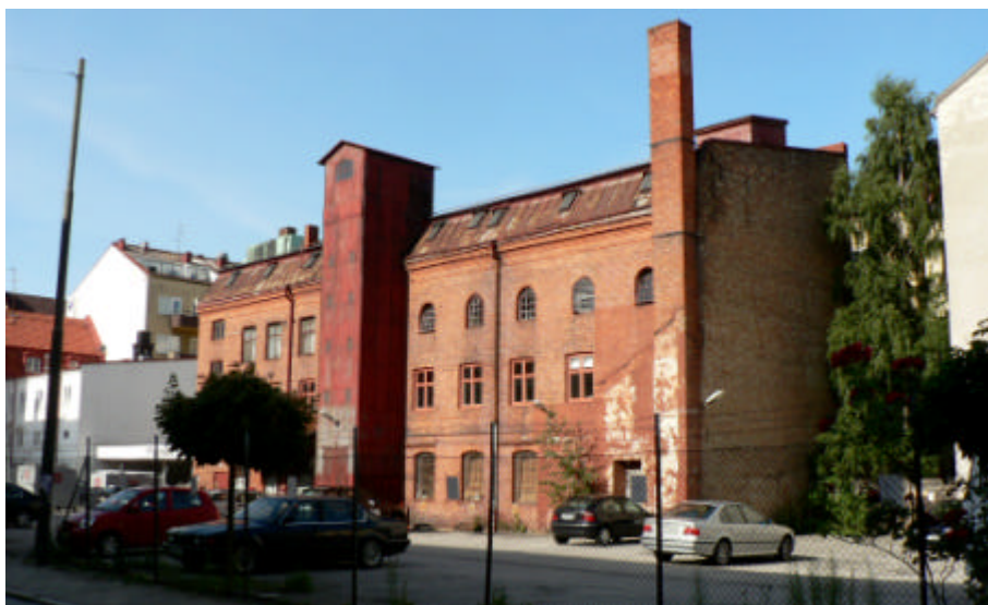
Figur 1. Kryddfabriken från sydväst.

Utredningen är utförd i juli 2006 av Olga Schlyter, byggnadsantikvarie på Malmö Kulturmiljö, på uppdrag av Stadsbyggnadskontoret, Malmö stad.