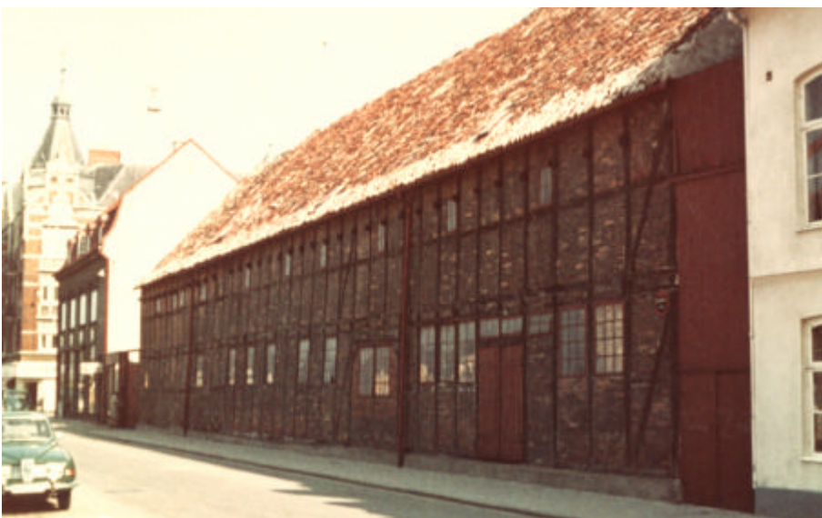
Figur 6. Korsvirkeslängan utmed Stora Trädgårdsgatan. inför flytten till kvarteret S:t Gertrud 1969.