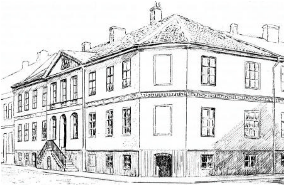
Figur 4. Berg von Lindska gården. Bostadshuset med huvudfasad mot Östra Tullgatan.