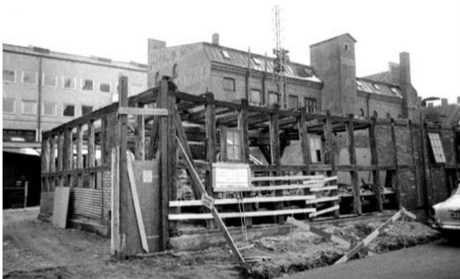
Figur 9. Nedmontering av gatuhuset inför flytten till kvarteret S:t Gertrud 1969. I bakgrunden syns gårdsbyggnaden.