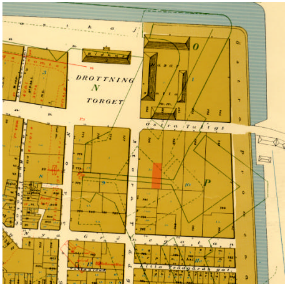
Figur 3. Utsnitt av A.U. Isbergs karta över Malmö från 1875. De gamla befästningsverken är markerade med gröna linjer. Kryddfabrikens nuvarande läge markerat med rosa.

Där kvarteret Sågen är beläget idag låg stadens östra befästningsverk (se figur 3). Dessa byggdes under andra halvan av 1600-talet, sedan Skåne blivit svenskt. 1805-07 raserades vallarna och staden utvidgades med ett vinkelrätt gatunät utanför den medeltida stadskärnan. I samband med detta anlades Drottningtorget, och gatorna söder och öster om torget. Kvarteret Sågen var då dubbelt så stort som det är idag, och gick ända fram till Östra Promenaden. Österportsgatan tillkom först i och med en stadsplaneändring 1903.