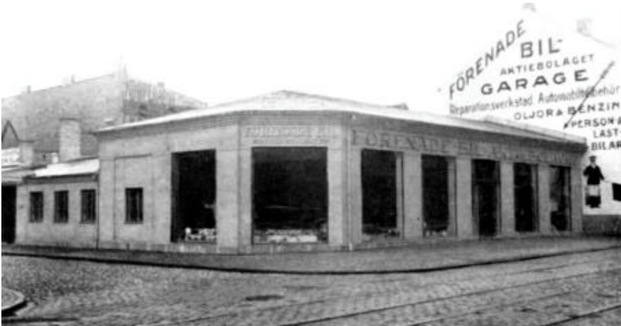
Figur 5. Kvarteret Sågen från nordost i början av 1920-talet. I förgrunden Förenade bil, i bakgrunden Kryddfabriken.