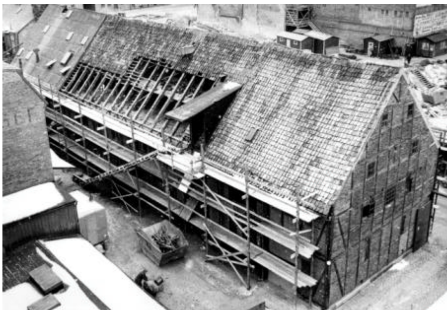
Figur 8. Nedmontering av gatuhuset inför flytten till kvarteret St Gertrud 1969.

1941 hade Kooperativa förbundet planer på att riva korsvirkeslängan utmed gatan och uppföra en modern fabriksbyggnad på dess plats. Ritningar över den tänkta byggnaden finns på Stadsbyggnadsnämndens arkiv. Det är en fyra våningsbyggnad med sadeltak och stora, regelbundet placerade treluftsönster. Arkitekturen är typisk för det malmöitiska 1940-talet, och ser man bara fasadritningen skulle man kunna missta byggnaden för ett bostadshus. På planritningarna framgår dock att man tänkte sig helt öppna våningsplan, vilka benämns "arbetslokal". Av någon anledning avslogs bygglovsansökan, och projektet kom aldrig att realiseras. (se bilaga 3, ritning 5-6)