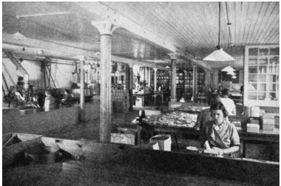
Figur 7. Interiörbild från Kooperativa förbundets kemisk tekniska fabrik. Bilden är sannolikt från andra våningen.

1904 gjordes en tillbyggnad i vinkel i söder. Det var ett stall med två stallplatser och foderloft. Byggnaden var i ett och ett halvt plan och hade pulpettak. Denna vinkelbyggnads siluett är idag synlig på magasinsbyggnadens fasad.