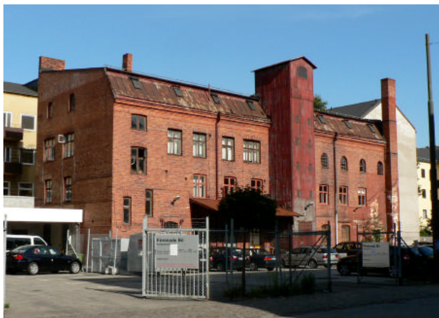
Figur 10. Kryddhuset från nordväst. För mer foton, se bilaga 1.

Högst upp på norra gaveln har reklamtext varit målad på fasaden, vilket delvis är synligt idag. Centralt på västra fasaden finns ett utanpåliggande hisschakt med fasader i rödmålad sinuskorrugerad plåt. Norr om hisschaktet finns ett skärmtak i sinuskorrugerad plåt över en del av bottenvåningen. Vid skärmtaket har det funnits en lastbrygga som numera är borta. Entrén till byggnaden är längst norrut på den västra sidan. Därifrån når man det murade trapphuset som går upp till vinden. Enkla trappor i trä finns också mellan våningsplanen i den södra delen av huset.