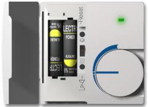
Bild 4. Trådlös termostat