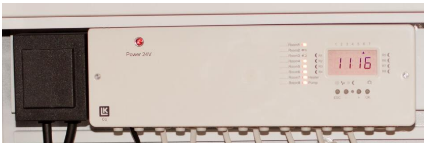
Bild 2. Släckta dioder på slingorna 2 och 3

Temostaten för rum 2 kallar just nu inte på någon värme, därför är diod 2 och 3 släckta (Bild 2).