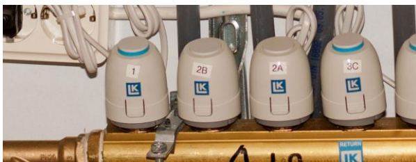
Bild 3. Ställdon

Ställdon 2 och 3 är stängda, vilket stoppar flödet av varmvatten i dessa slingor (Bild 3). Det tar några minuter för ställdonen att skifta läge.