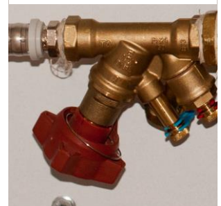
Bild 7. STAD-ventil på utloppsriör