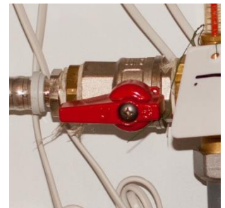
Bild 6. Kulventil på inloppsriör